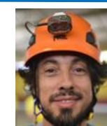
Ref. Espeleomergulho Rodrigo Severo EGB - DF