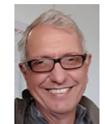
Comunicação Alfredo L. Bonini GPME - SP