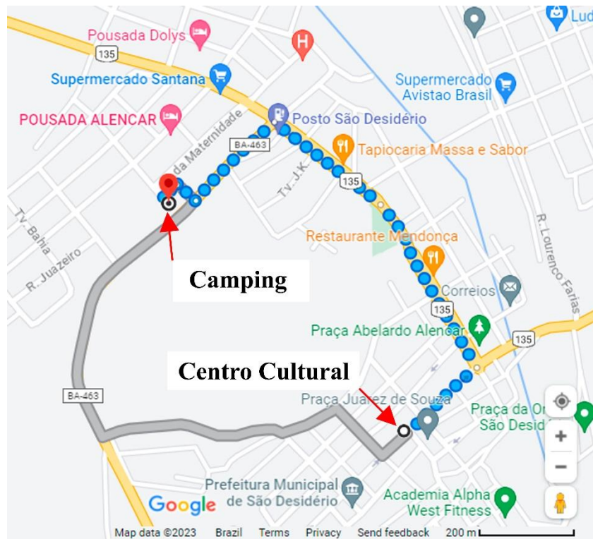
Figura 4: Mapa representando o deslocamento a pé, de 15 a 20 minutos, do camping até o Centro Cultural (auditório das aulas teóricas).

A partir do dia 02/09, as barracas devem sair do espaço da quadra coberta e serem montadas no gramado do estádio na área externa , para que a quadra poliesportiva coberta possa ficar disponível para os treinos e uso recreativo usual. A organização do CNE2023 pede desculpas por esse transtorno da necessidade da mudança de local das barracas e pede a compreensão e colaboração das pessoas inscritas no curso para que a infraestrutura do centro esportivo possa ser utilizada por ambas as partes (Curso de Espeleorresgate e comunidade local), sem prejudicar o andamento das atividades culturais da cidade e permitindo a utilização do camping gratuito por parte dos alunos do curso da SER.