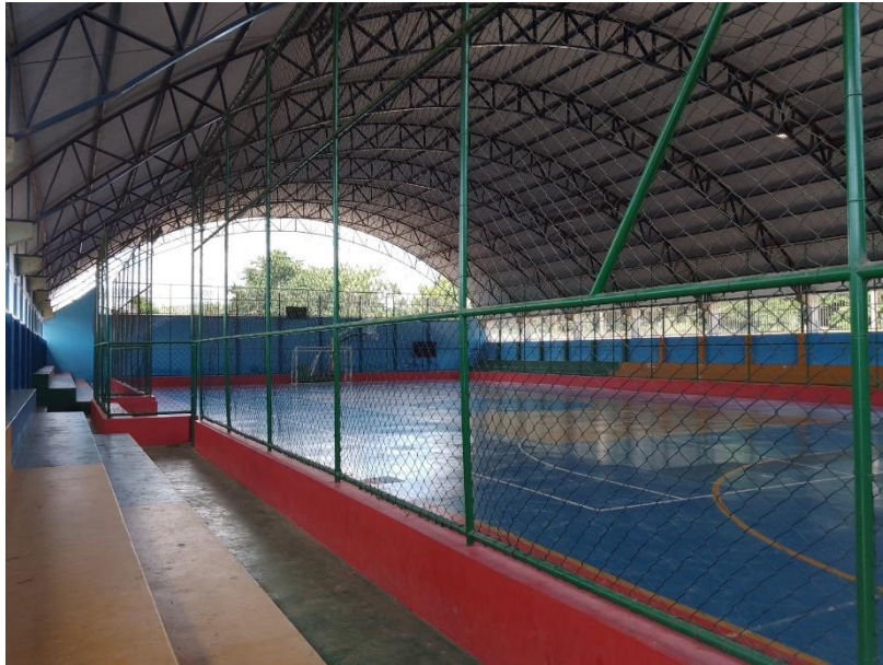
Figura 2: Espaço interno do ginásio, com quadra poliesportiva coberta.