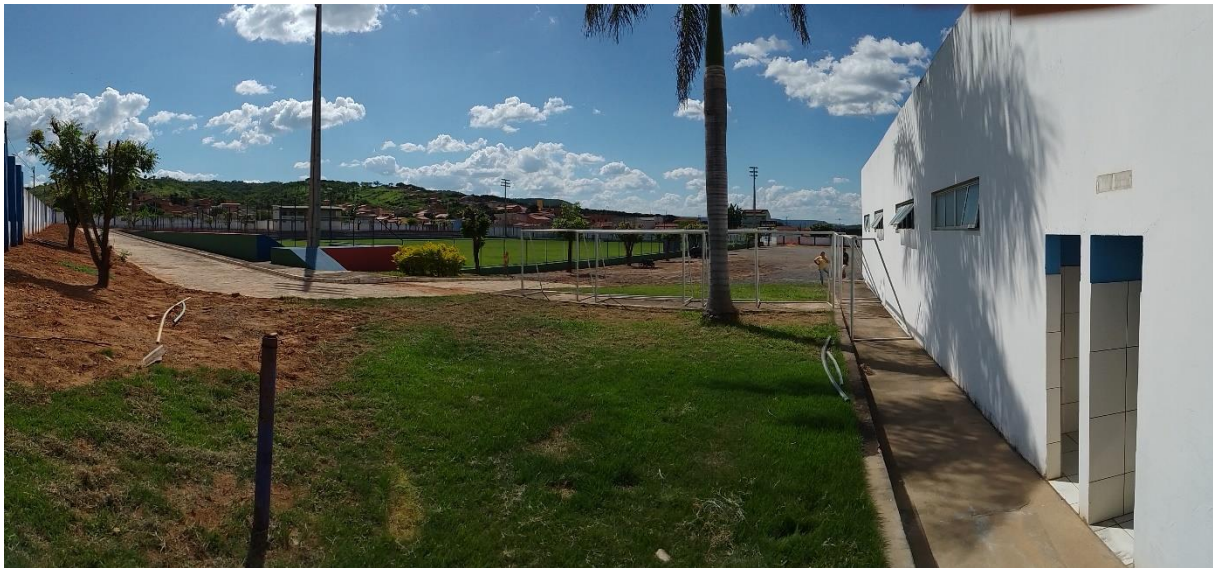
Figura 3: Espaço externo do estádio de futebol, no plano de fundo, e banheiros da área externa, em primeiro plano.

O deslocamento do camping até o Centro Cultural (auditório onde serão ministradas as aulas teóricas) pode ser feito a pé em cerca de 15 a 20 minutos (Figura 4). No entanto, estará à disposição dos alunos do camping um a dois carros da prefeitura para auxiliar no transporte das pessoas do camping até o Centro Cultural, para aqueles que desejarem. Sendo assim, pedimos a todas os(as) alunos(as) do curso que se programem para estar, pontualmente, no auditório pelo menos 10 minutos antes do início das aulas.